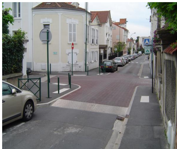
Carrefour surélevé (Nogent sur Marne)