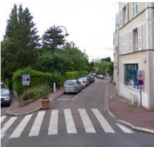
Entrée de quartier avec aménagement léger (Sceaux)

S'il existe plusieurs manières de créer un effet de porte en entrée de zone 30, le trottoir traversant semble devenir la norme pour le passage des boulevards aux quartiers ; celui-ci permet à la fois de marquer le passage d'un espace à dominante trafic à un espace de vie, et de rétablir la continuité des cheminements piétonniers.