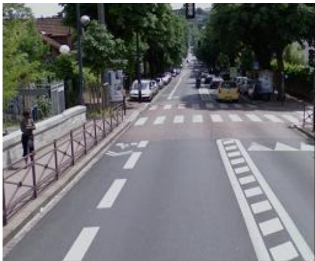
Bd à 30 avec bande cyclable dans sens montant et plateau (Fontenay aux Roses RD 67)

La dynamique du Conseil Général est un élément clé ; il peut être proactif, neutre ou bien un frein, mais dans tous les cas le maire qui a pouvoir de police peut imposer la modération de vitesse sur son territoire.