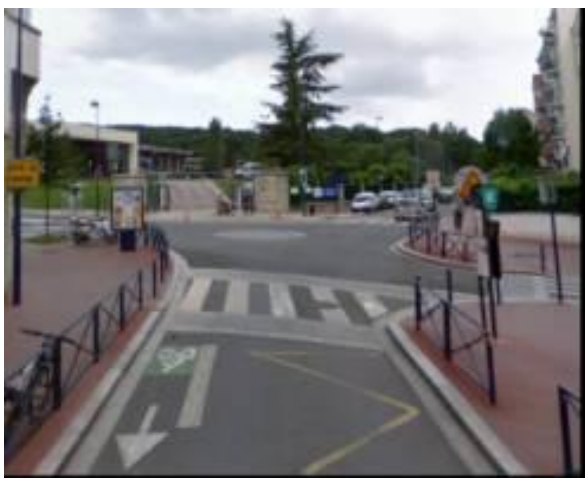
Section courante à double sens cyclable et mini giratoire (Clamart)

Aux intersections c'est le régime de priorité à droite qui prévaut, éventuellement renforcé par un carrefour surélevé, ou un mini giratoire (peu répandu en IdF).