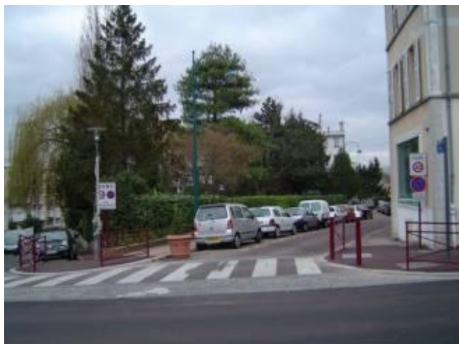
La même entrée en définitif avec trottoir traversant