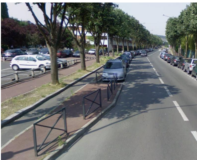
Bd à 50 avec piste entre trottoir et stationnement (Fontenay aux Roses / Sceaux RD75)