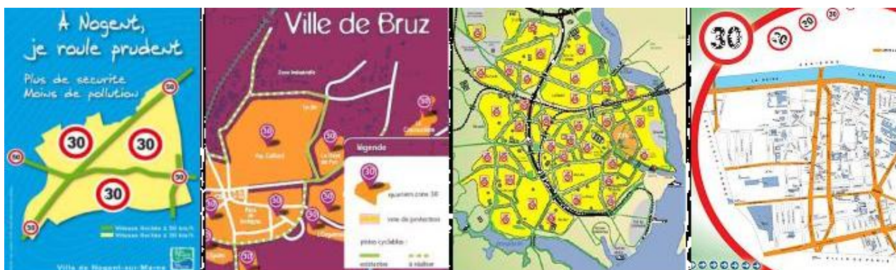
Déclinaison du concept à Nogent sur Marne(94), Bruz (35), Lorient (56) et Clichy la Garenne (92)